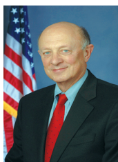
ראש הסי.אי.איי. לשעבר ג'ימס וולסי