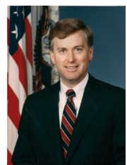
סגן הנשיא לשעבר, דן קווילי

יהונתן פולארד זקוק לנו! מצבו קשה ונשקפת סכנה לחייו!