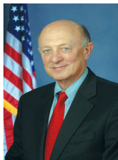
ראש הסי.איי. לשעבר ג'ימס וולסי