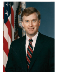
סגן הנשיא לשעבר, דן קווילי

יהונתן פולארד זקוק לנו! מצבו קשה ונשקפת סכנה לחייו!