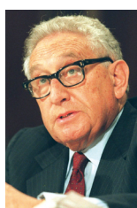
שר החוץ לשעבר של ארה"ב הנרי קיסינג'ר