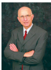
סגן שר ההגנה לשעבר, לורנס קורב