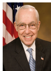
התובע הכללי לשעבר, מייקל מוקאסי