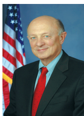
ראש הסי.איי. לשעבר ג'ימס וולסי