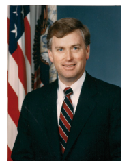
סגן הנשיא לשעבר, דן קווילי

יהונתן פולארד זקוק לנו! מצבו קשה ונשקפת סכנה לחייו!